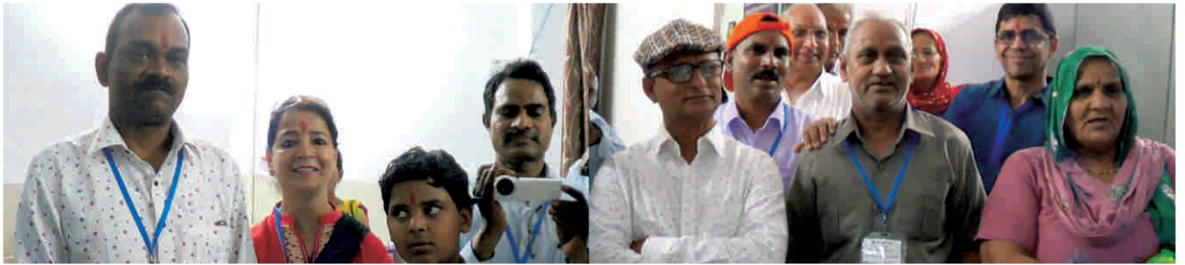
दौरे के पश्चात खुष एवं संतुष्ट अतिथिगण